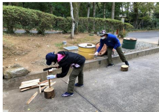
アイスブレイク 火起こし