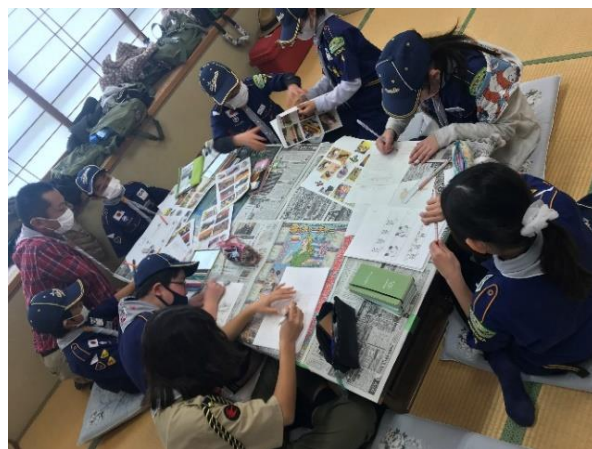
試行錯誤しながらのクルマの設計中

小学生から大人までが熱くなれるプログラムでしたが、来年は今回の経験を活かし、また挑戦したいと思います!!!