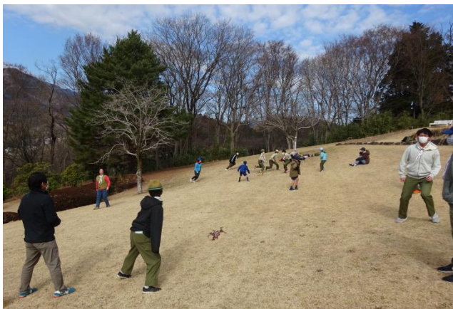
“イノシシ狩り”ゲーム