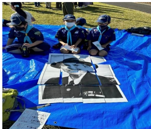
「あたまを使って」パズル