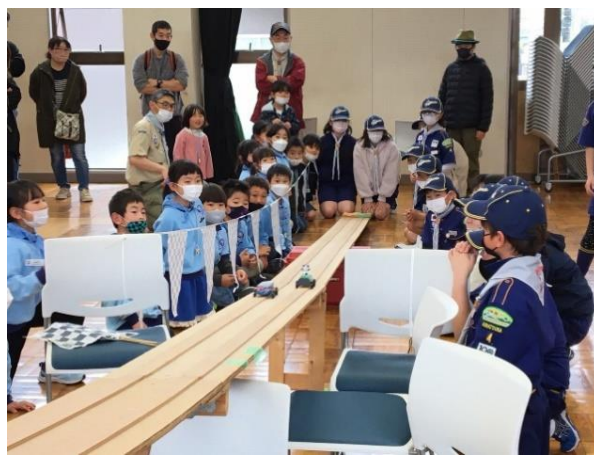
みんなで応援！！最後まで頑張れ！