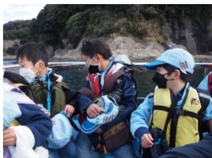
ライフジャケットを付けてさあ出向！