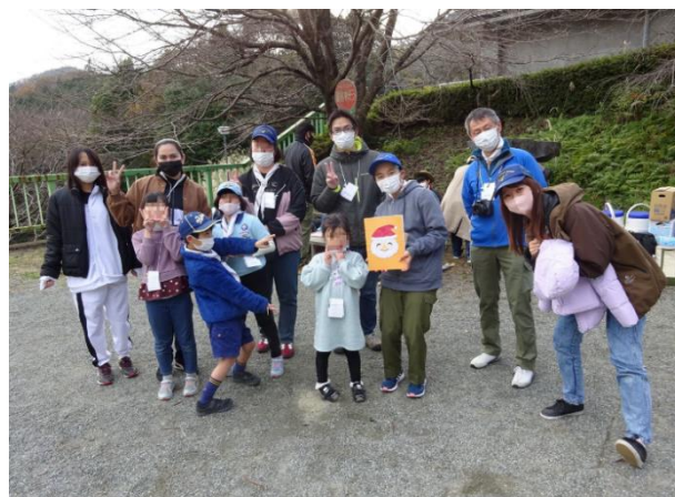
ハイキングでサンタが完成!