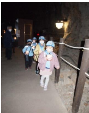
岩屋の洞窟はろうそくを手にもって