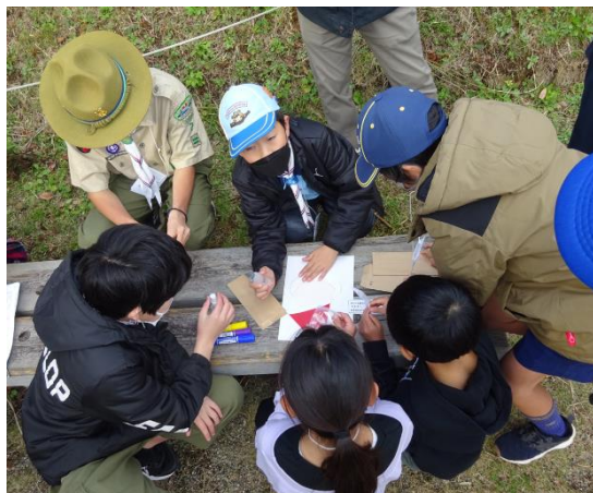
チームワークで課題に挑戦

参加者をバランスよく3つの混合班に分け、ハイキング、スタンプ、全体ゲーム、クラフトなどに挑戦しました。どの班もチームワークよく課題をこなし、部門や役割を越えて、団がまとまった活動でした。