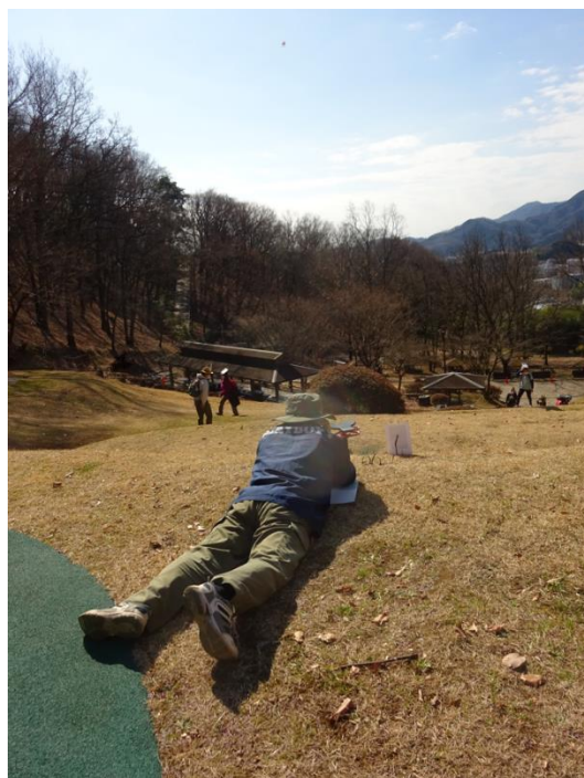
“ナンバーコール”ゲーム(SFBの表紙風)