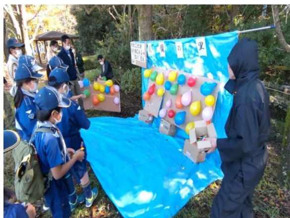
「風魔の修行」手裏剣投げ