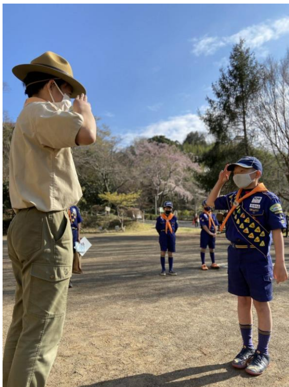
隊長より最後の 40 個目のチャレンジ章授与