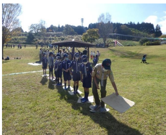
「酒匂川渡り」川渡り