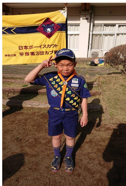
たすきに全てのチャレンジ章を付けて