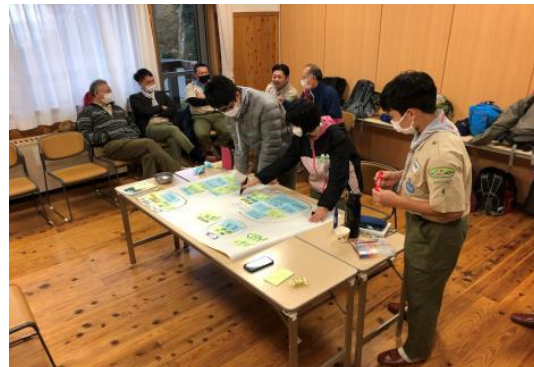
テーマ:「できないこと、できることー進級について話し合おうー」