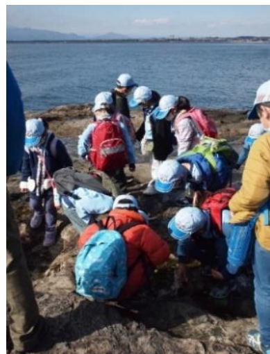
何があるか磯遊び！