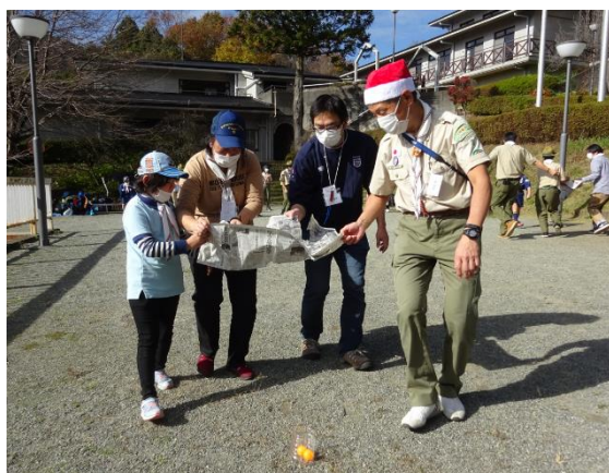
対班ゲームで大盛り上がり!