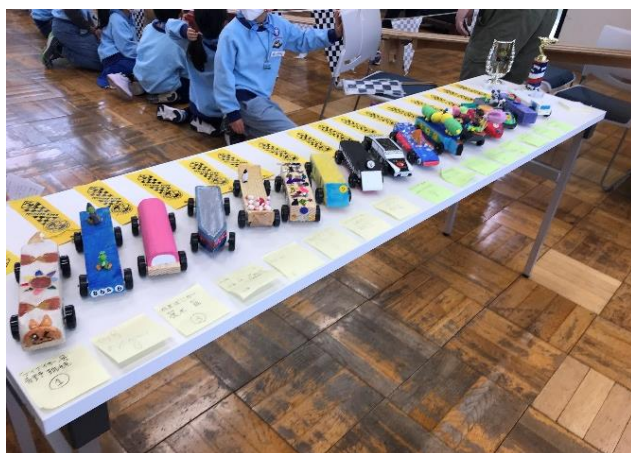
個性豊かなパインウッドカーが勢ぞろい

3月26日に「パインウッドダービー2023公民館グランプリ」を開催しました。元々、パインウッドダービーとは松の木を加工したクルマを作って競争する、ボーイスカウトアメリカ連盟のカブスカウトのイベントです。今回は日程が合わなかった為、アメリカ連盟との交流会は無く、本大会には参加できませんでしたが、隊集会でグランプリを開催しました。