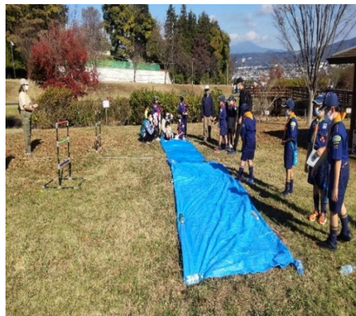
「星に願いを」ラダーゲーム