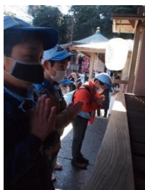
江の島神社にお参り

午後は岩屋の探検。途中川崎のビーバー隊とお会いし挨拶をかわしました。第1岩屋はろうそくを手に持ち幻想的。第2岩屋はイルミネーションでファンタジックな感じで、目を輝かせていました。岩屋の穴から見える海もキラキラと、春を感じさせるような景色でした。乗船前に少し時間があり、磯遊びもできました。江ノ電江の島駅に行く途中で、買い物をしましたが、あれこれ悩みながら買い物をし、ビーバーさんの面倒を見てあげるピックビーバーさんもいて、成長を感じた1日でした。