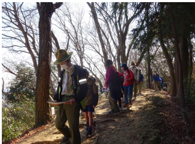
“ウォーキングキムス”