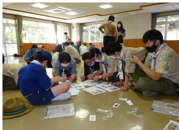
キーホルダー作りもみんなで協力