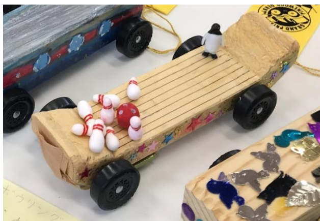
「デザイン」部門1位の「ペンギンボーリング」

保護者の多大なるご協力もあり、大会当日には素晴らしい個性豊かなパインウッドカーが勢ぞろいすることができました。