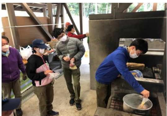
昼食(炊き込みご飯、ハンバーグ)