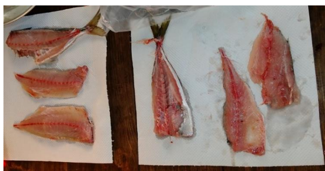
新鮮なあじの3枚おろしに挑戦した！ レシピ通りに調理しおいしくいただきました(*^-^*)