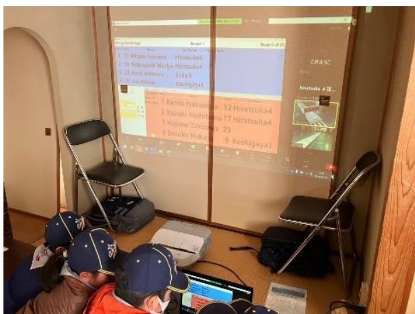
プロジェクターで投影したレース結果にくぎ付け!