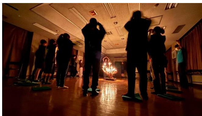
アンノンスカウトの逸話を班ごとにスタンツ

防災をテーマにしたスカウトフォーラムでは、災害の知識に関するアイスブレイクをしたあと、能登半島地震にボーイスカウトのボランティア活動として3日前まで現地で奉仕活動をしたローバースカウトから、現地の様子や自分たちにできることを基調報告してもらった。その後、「大地震にむけ、自分たちが備えておくこと」をテーマに設定し、班ごとに話し合いを進めた。話し合い⇒思考の拡散⇒話し合いの過程を踏むことで、短時間ではあったが、充実した協議になった。また、3日間をともに過ごしたスカウトの関係性が協議の広がりにも効果的であった。