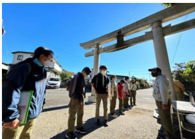
CP1 高来神社 計測(歩測)