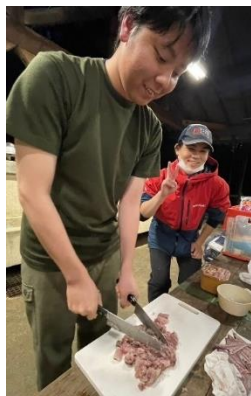
アジの春巻き リーダーもなめろうに挑戦