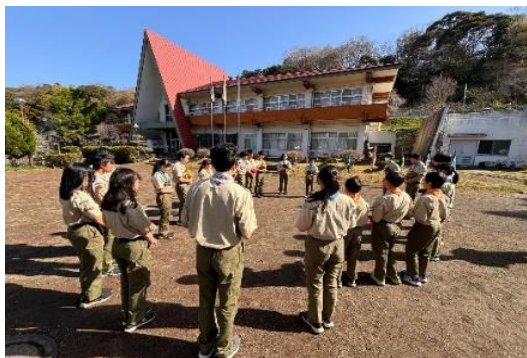
ベンチャー主導によるスカウトウオンサービス