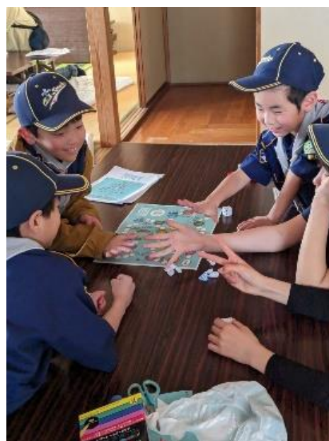
レースの合間に国連の配信しているSDGsすごろくあそび