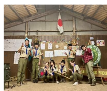
2月11日 CSデン作り集会 それぞれ個性が... 3月10日 BS 受験お疲れ様会