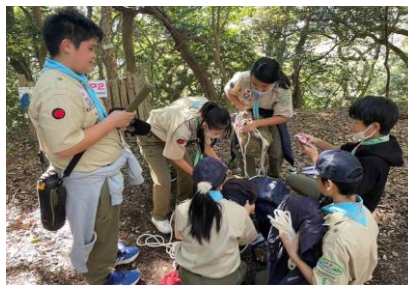
CP2 高麗山 積上げ(個人装備)