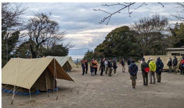
雨の合間に3種テント設営を終える

進級別課目の挑戦として①隼章取得に向けて、自らが計画者となってキャンプを実施する。②菊章取得に必要な、信仰奨励章の取得を目指す。③1級章取得に向けて、野帳、略地図の作成を行うことに取り組んだ。