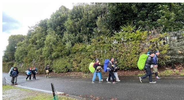
野営地である湘南平の道和幼稚園施設から平塚市びわ青少年の家に移動野営