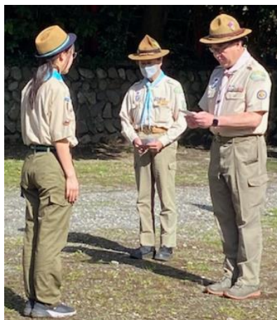
工藤地区コミッショナー から菊スカウト章伝達