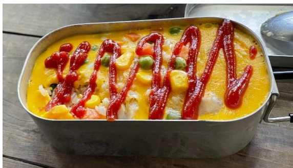
メスティンで作るオムライス