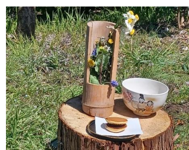
3月10日 BVS「うれしいひなまつり」菓子(どらやき)作りと野点で春を満喫しました!