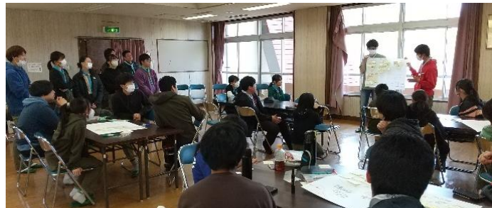
防災をテーマにしたスカウトフォーラム