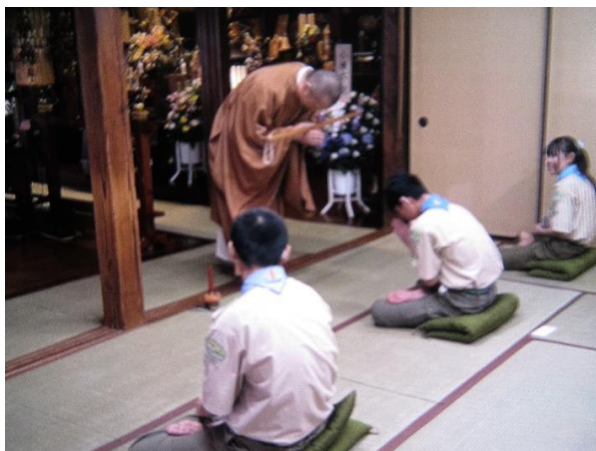
(第2教程)、比叡山延暦寺会館