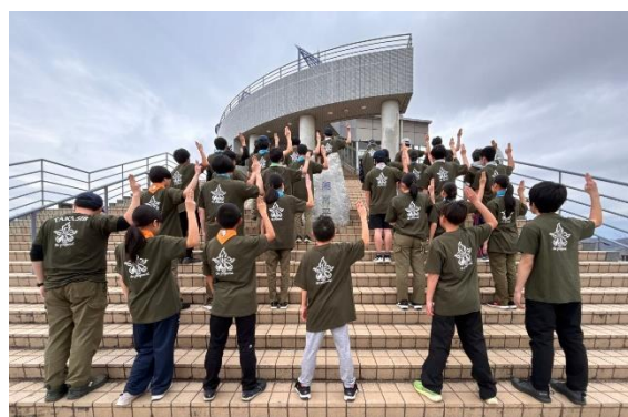
おそろいのTシャツで4日間の野営を誓う!